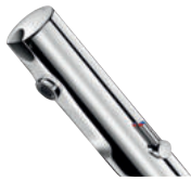
Elektronische Mischbatterie TEMPOMATIC MIX 4 Artikelnummer 490100