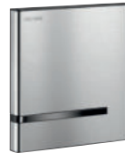
Betätigungsplatte TEMPOMATIC 4 für Urinal Artikelnummer 430000