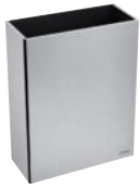
Abfallbehälter aus Edelstahl Werkstoff 1.4301 Wandmontage, 38 Liter Artikelnummer 510463S