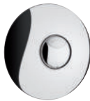
Betätigungsplatte TEMPOFLUX 2 für WC Artikelnummer 578222