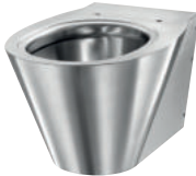
WC BCN S wandhängend Artikelnummer 110110