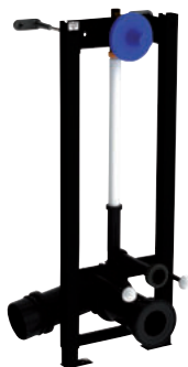
Vorwand-Installationssystem TEMPOFIX 3 für WC Artikelnummer 578300DE